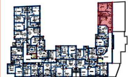
PLAN DU 6ème ETAGE