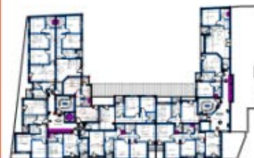
PLAN DU 6ème ETAGE